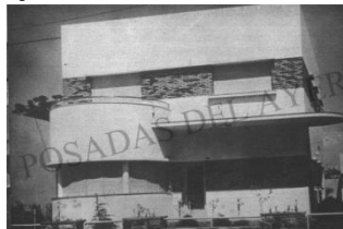
Colón casi S.Martín demolido 2008