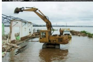
( Leo Duarte Face )